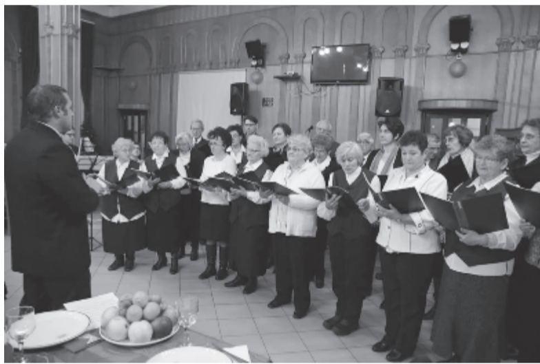
A felsővárosi református egyházközség kórusa